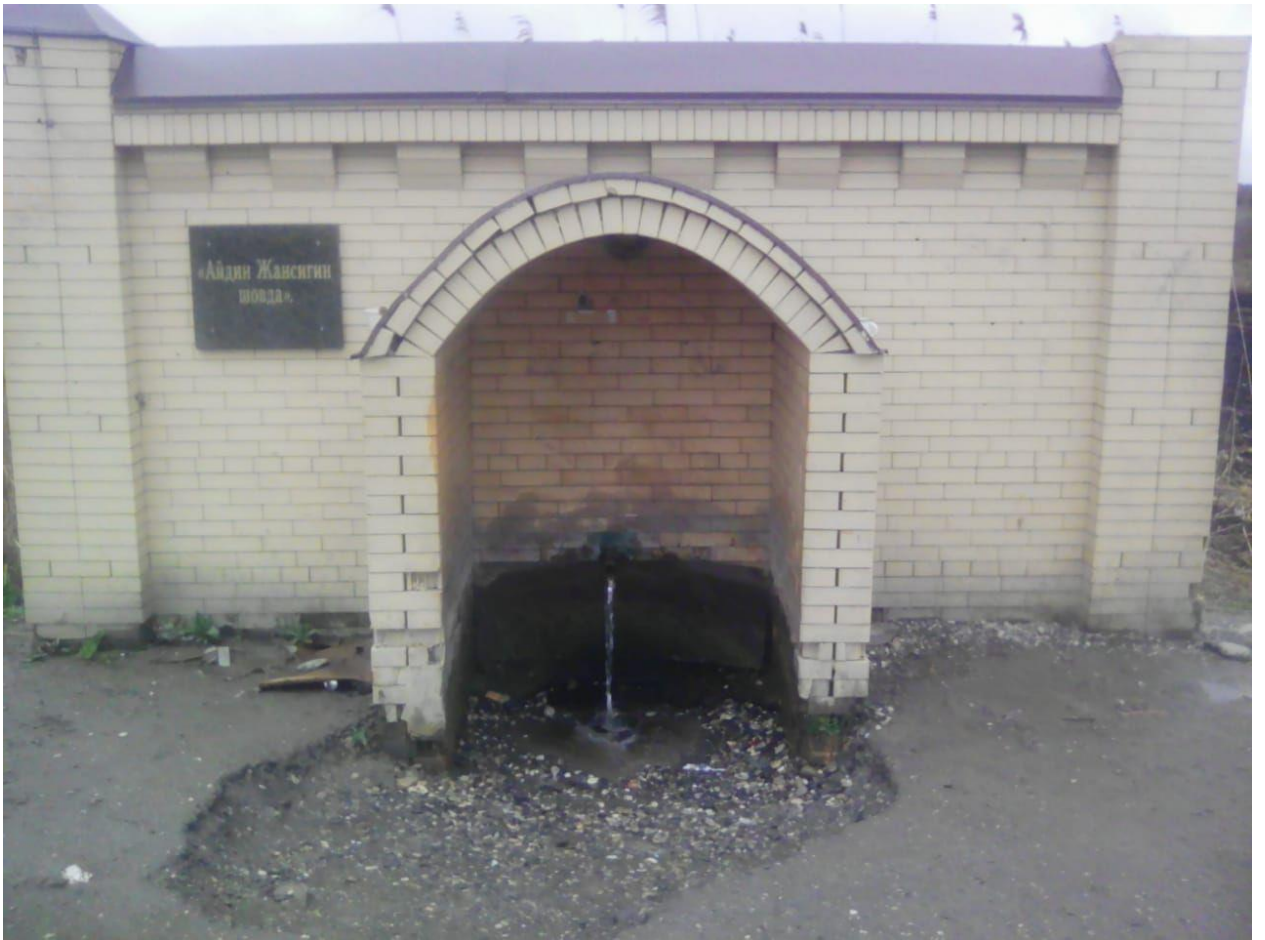
Шовда (родник ) «Айдин Жансигин шовда»