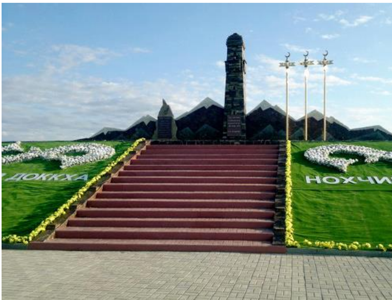
Памятник чеченским женщинам — жертвам «трагедии в селении Дади-юрт»